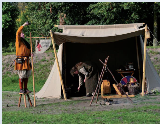
Unterkunft während der Burgmannentage

Die Pferdestadt Vechta hat eine Universität, den berühmten Stoppelmarkt, ein Museum und Mittelalter-Zentrum – und jetzt auch auch einen Turm, den man schon von weitem sehen kann.