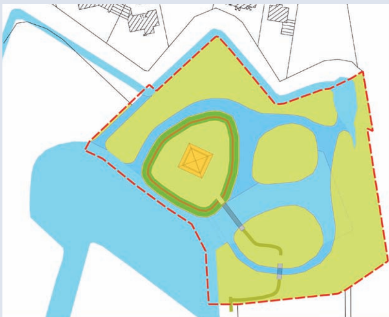
Grob skizziert: die Inseln und der Turm

Ein Ausflugstipp für einen Tagesausflug nach Vechta - Freizeit für Eltern, Kinder und Gruppen hier bei schoener-ausflug.de